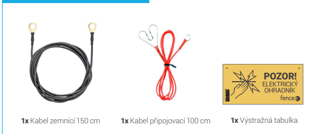
1x Kabel zemnicí 150 cm